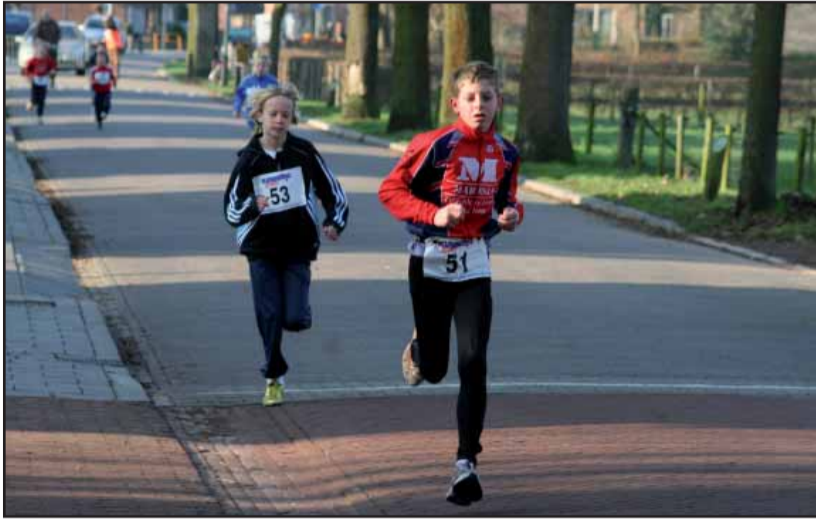
De organisatie hoopt op veel animo bij de speciale loop voor de jeugd

Op zondag 11 december gaat alweer de vijfde Waspikse Stratenloop van start, mede dankzij de inzet van vele vrijwilligers. Deze loop, die ooit als afsluiting van het jubileumjaar Waspik 750 voor de eerste keer werd gehouden, begint elk jaar in Waspik maar ook in de regio steeds meer lopers te trekken. Vorig jaar stonden dan ook maar liefst 250 lopers aan de start. In een periode waar relatief weinig stratenlopen worden georganiseerd vinden veel atleten en trimmers het fantastisch om in de dagen voor Kerst de uitdaging met de Waspikse elementen aan te gaan. Ondanks de beperkte opkomst bij de schoolgaande jeugd hoopt de organisatie van harte dat de Waspikse jeugd dit jaar massaal naar dit evenement zal komen. Voor de deelnemers zijn naast een traktatie leuke bekertjes te winnen voor de eerste drie lopers. De afstanden en de indeling naar leeftijd is