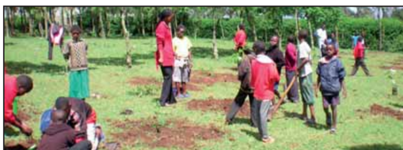
In het Tania Integrated Centre worden kinderen tussen 2 en 17 jaar geholpen een bestaan op te bouwen.