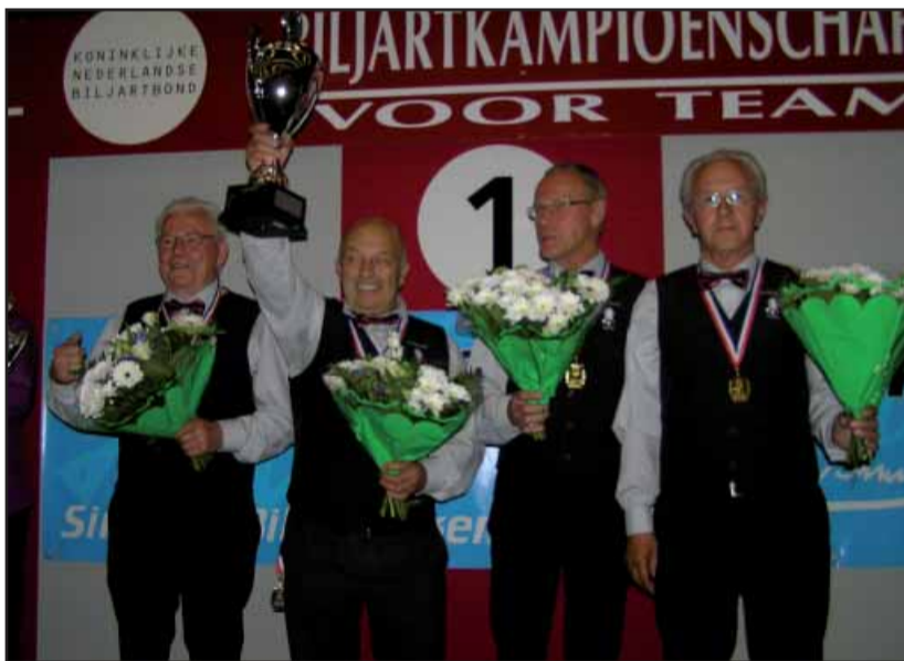
Het eerste team van biljartvereniging Den Bolder schreef geschiedenis op het NK

Waarschijnlijk is het een unicum in de geschiedenis van ons dorp, maar sinds kort huisvest Waspik een zestal Nederlandse kampioenen. Verantwoordelijk voor deze historische gebeurtenis zijn de biljarters van het eerste team van biljartvereniging Den Bolder. Nadat ze in een eerder stadium hun concurrenten op districts- en regionaal niveau hadden verslagen, mochten ze onze provincie vertegenwoordigen op de Nederlandse kampioenschappen in Nieuwegein.