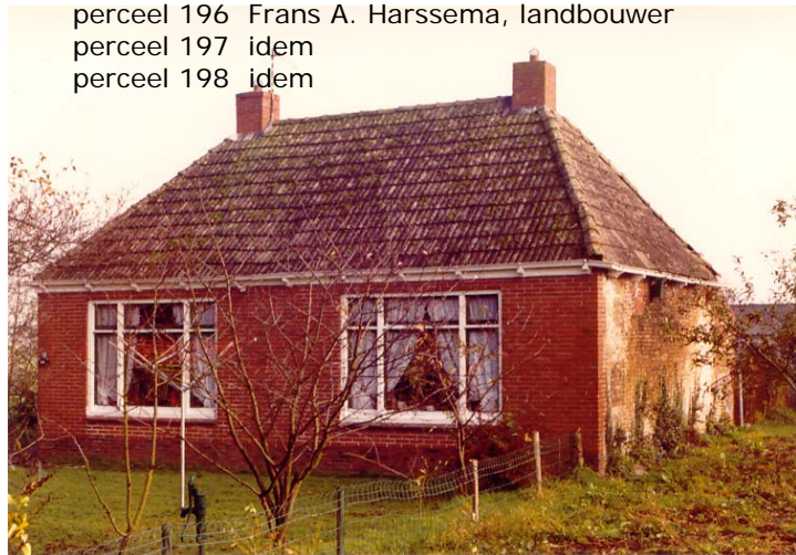
Voormalige weverij te Eibersburen